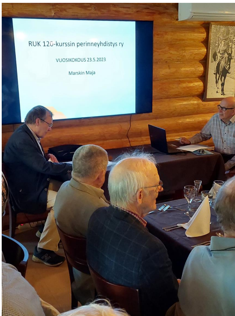
Tapahtumat Majalla aloitettiin ravintolassa pidetyllä

perinneyhdistyksen vuosikokouksella. Kokouksen aluksi muistettiin viimeisen vuoden aikana kuolleita kurssiveljiä taustalla soiden Rukous-sävelet.